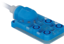
Anschlussbox Connection Box ZAA02R501, ZAA02R601